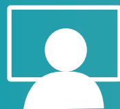
Securitas Operation Center (SOC)